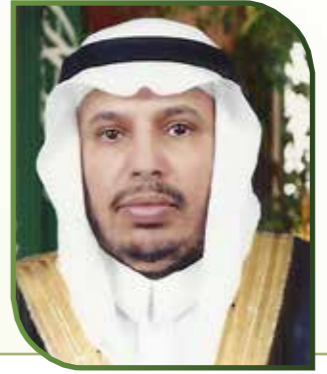
أ.د. عبدالرحمن بن عبيد اليوبي سعادة مدير الجامعة المكلف

في ضوء الإعداد الحديث للكوادر، والدور الذي تضطلع به الجامعات، والمرحلة التاريخية التي يمر بها الإنسان في عصرنا في ظل المتغيرات الهائلة في مجال الهندسة البشرية، بادرت جامعة الملك عبد العزيز إلي إنشاء « وحدة الإرشاد الأكاديمي » كركيزة مهمة في تطوير العملية التعليمية وتأسيس قواعد المشاركة والتفاعل والمساهمة في اتخاذ القرارات لبناء الشخصية القادرة علي مواجهة المستقبل بما يحمله من متغيرات.